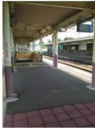
石打駅構内と駅時刻表。 ほぼ1時間に1本。

近くでお祭りがあってい たようで、駅前には出店も 数軒ありましたし、ちょう ど子供神輿とも遭遇する ことができました。