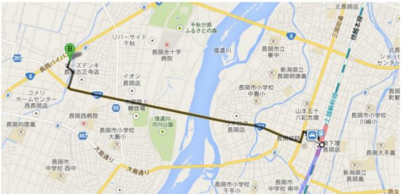
↑ 今回のルート（イメージ図）。橋のあたりからダッシュ。

近くでお祭りがあってい たようで、駅前には出店も 数軒ありましたし、ちょう ど子供神輿とも遭遇する ことができました。